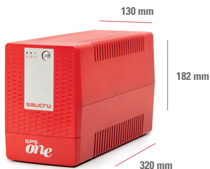
SPS 1100 ONE (UK/IEC)