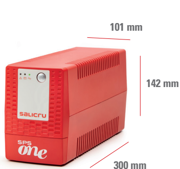
SPS 500÷900 ONE (UK/IEC)